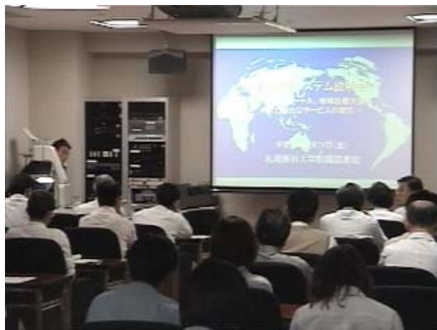
図．新図書館システム学内説明会風景

これからも附属図書館は、利用者の皆様のお役に立つよう努力して参りますのでご意見ご要望をお寄せいただきますようお願いしております。